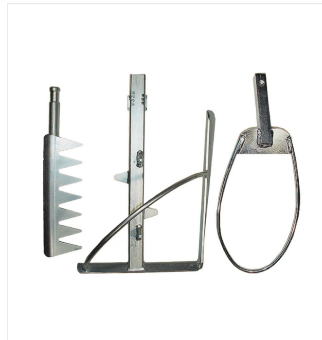
Outil de mélange spécifique garantissant un mélange homogène