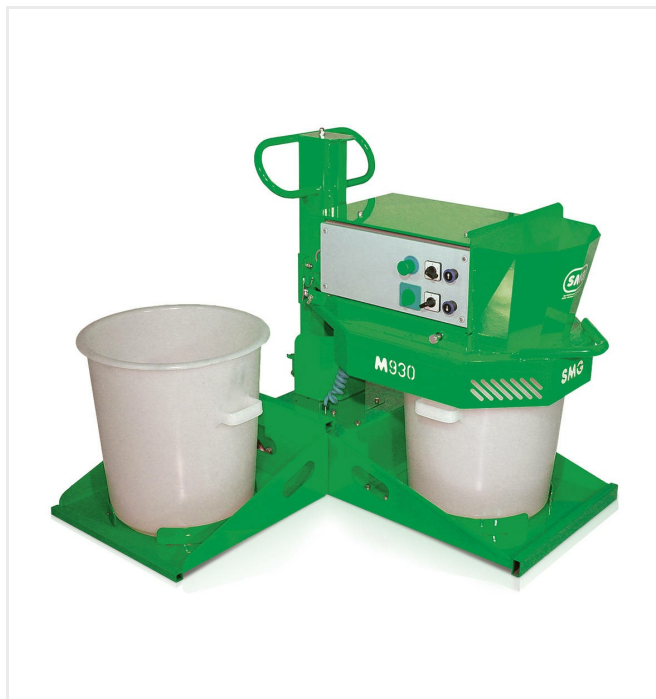
Tête de mélange à abaissement hydraulique jusqu'à la hauteur de travail