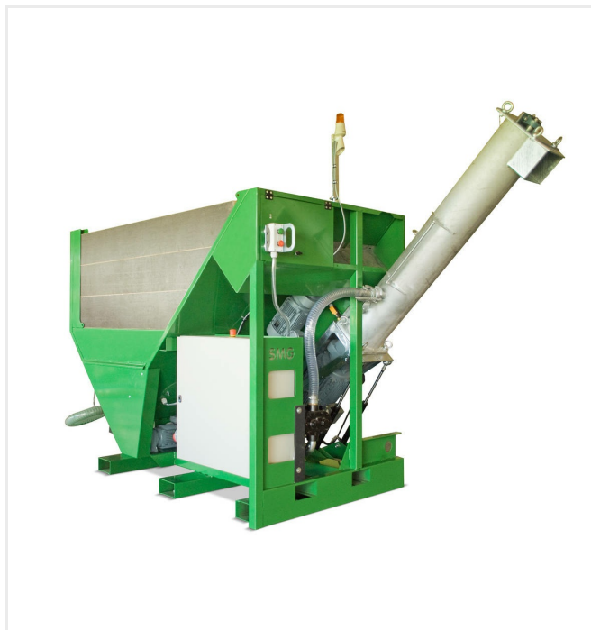
bez pojemnika na grys